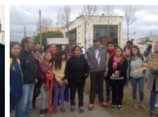
Integrantes del Movimiento Octubre se manifestaron por las agresiones del delegado de San Carlos