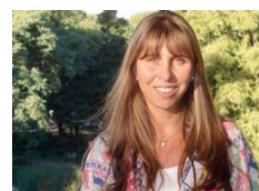
Corrupción en la dirección de Minería: Conozca el listado de los infractores perdonados por la Provincia