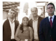
Amedrentan y persiguen a empleados del OPDS